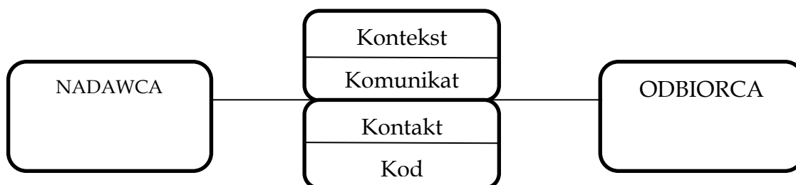
Ryc. 1. Schemat komunikacji w ujęciu R. Jakobsona

Do najbardziej znanych schematów komunikacji należy model Romana Jakobsona, który wyróżnia nadawcę i odbiorcę, a także kontekst, komunikat, kontakt i kod.